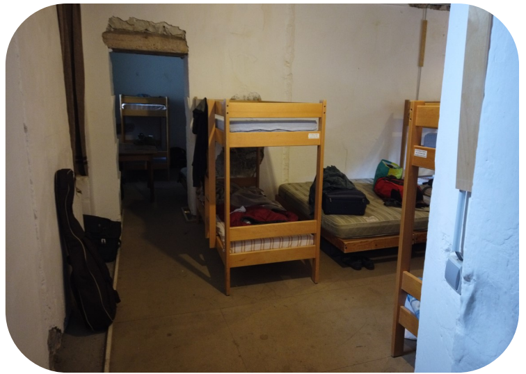
Dortoir du Pavillon des Sous-Officiers

Les dortoirs sont collectifs et mixtes, avec une capacité maximale d'une trentaine de personnes (plus on est de fous, plus on rit !).