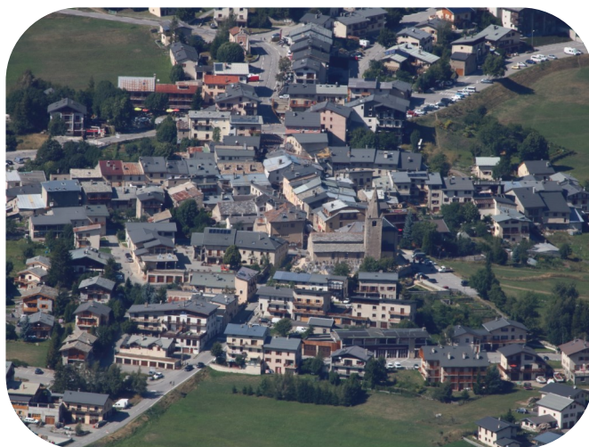
Aussois vu du ciel

Petit village savoyard constituant une charmante petite station familiale, l'été, Aussois s'anime d'une ambiance décontractée et chaleureuse. De jolis petits commerces pour ramener des souvenirs gourmands notamment !