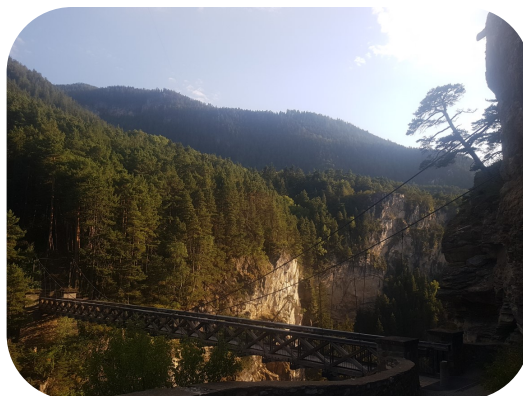
Le Pont du Diable