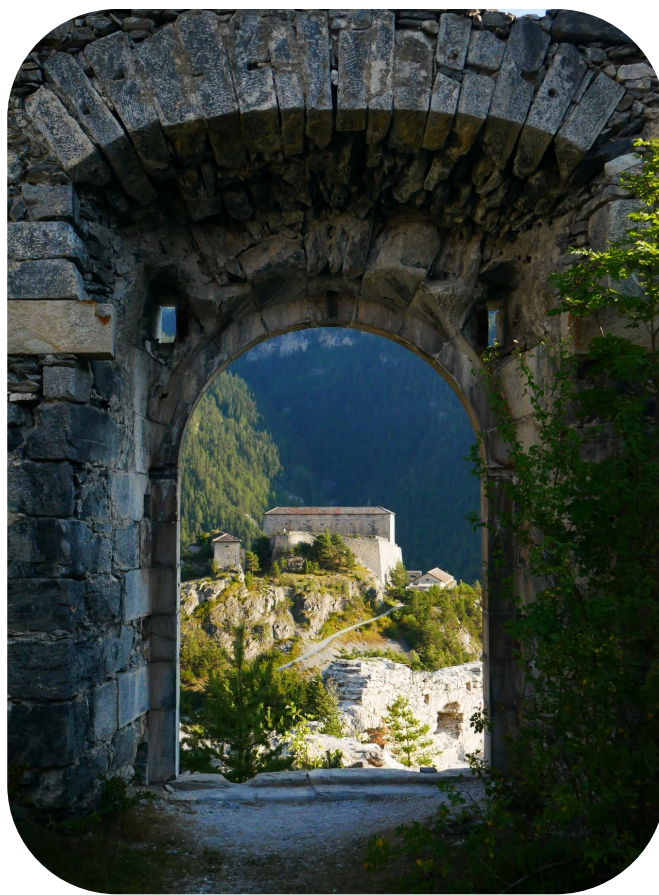
Victor-Emmanuel depuis Charles-Félix

La barrière rocheuse de l'Esseillon constituait un obstacle naturel parfaitement adapté au verrouillage de la vallée de l'Arc dans le sens France-Italie : front rocheux abrupt sans positions surplombantes du côté ouest, glacis facile d'accès du côté est. La topographie du terrain permettait d'assurer un contrôle pratiquement total des voies d'accès au Mont-Cenis, qu'il s'agisse du chemin muletier médiéval passant par Avrieux et Aussois ou de la route "moderne" du fond de vallée.