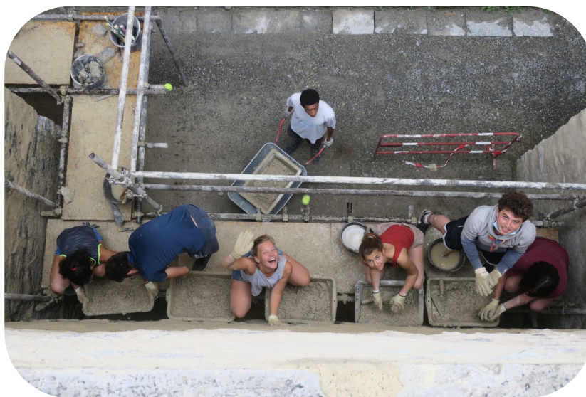
Rejointement d'un mur à la chaux

Les travaux sont encadrés par les anciens (certains viennent depuis 15 ans, tous les ans !!) et par des professionnels compétents (maçons, charpentiers ...). Chacun peut trouver un travail à sa mesure : des compétences techniques ne sont pas obligatoires.