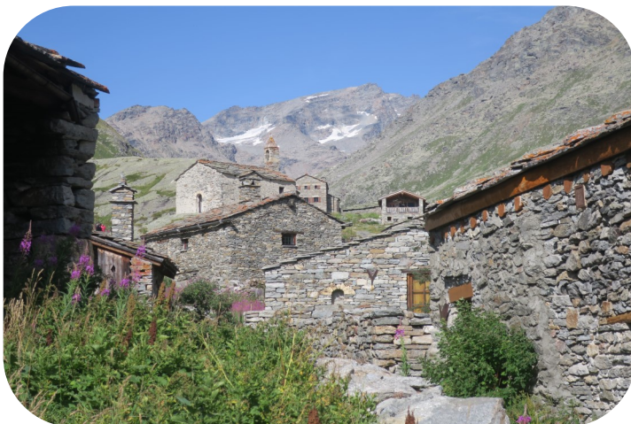
Hameau de l'Écot

Site classé et protégé, le hameau de l'Écot, et le village de Bonneval-sur-Arc en contrebas, sont dans les plus beaux villages de France, et méritent leur visite.