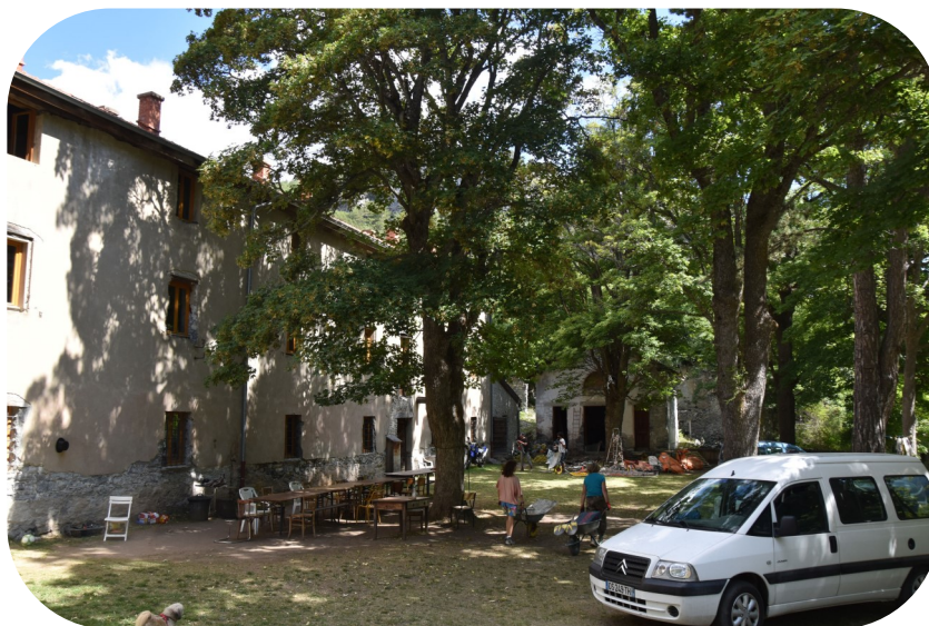
Pavillon des Sous-Officiers

Chacun doit participer à la vie communautaire comme par exemple l'élaboration des repas et les ravitaillements, ou l'entretien des parties communes.