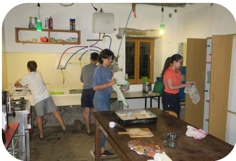
Équipe cuisine à l'œuvre

En cuisine , les repas sont préparés par un responsable de cuisine, assisté de deux bénévoles chaque jour. L'équipe cuisine est renouvelée tous les jours. Chacun participe aux courses, à la préparation des repas et à la vaisselle, sous la direction du responsable de cuisine. Confrontés chaque année à différents régimes alimentaires (végétariens, sans porc, halal),