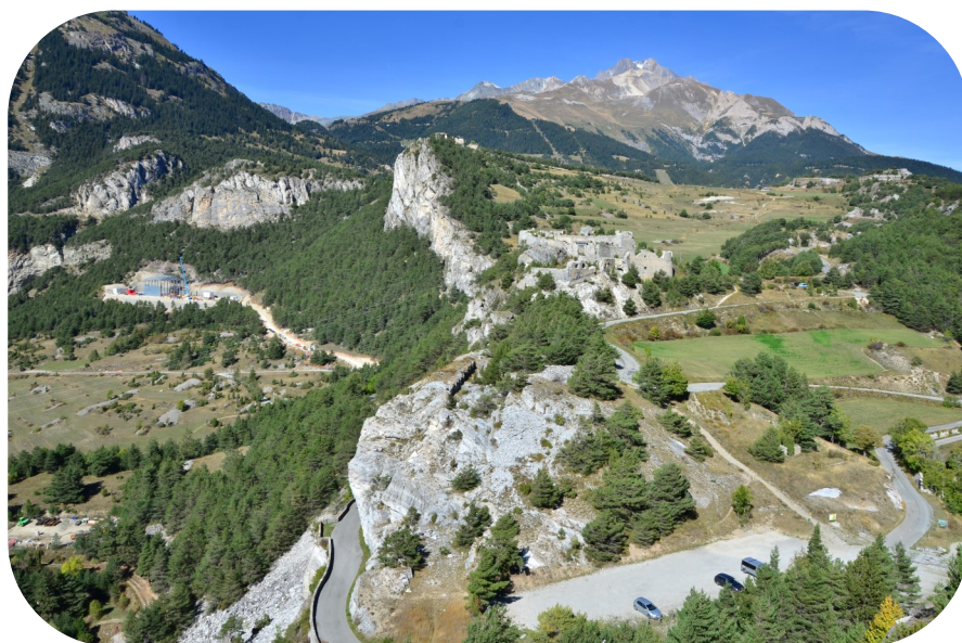
La barre rocheuse surplombée de Marie-Christine et de Charles-Félix, depuis Victor-Emmanuel

Le système défensif de l'Esseillon est bien entendu dirigé vers la France : les accès sont orientés à l'est, sous le couvert des forts, et les embrasures de tir sont orientées en priorité vers l'ouest. Deux redoutes pratiquement