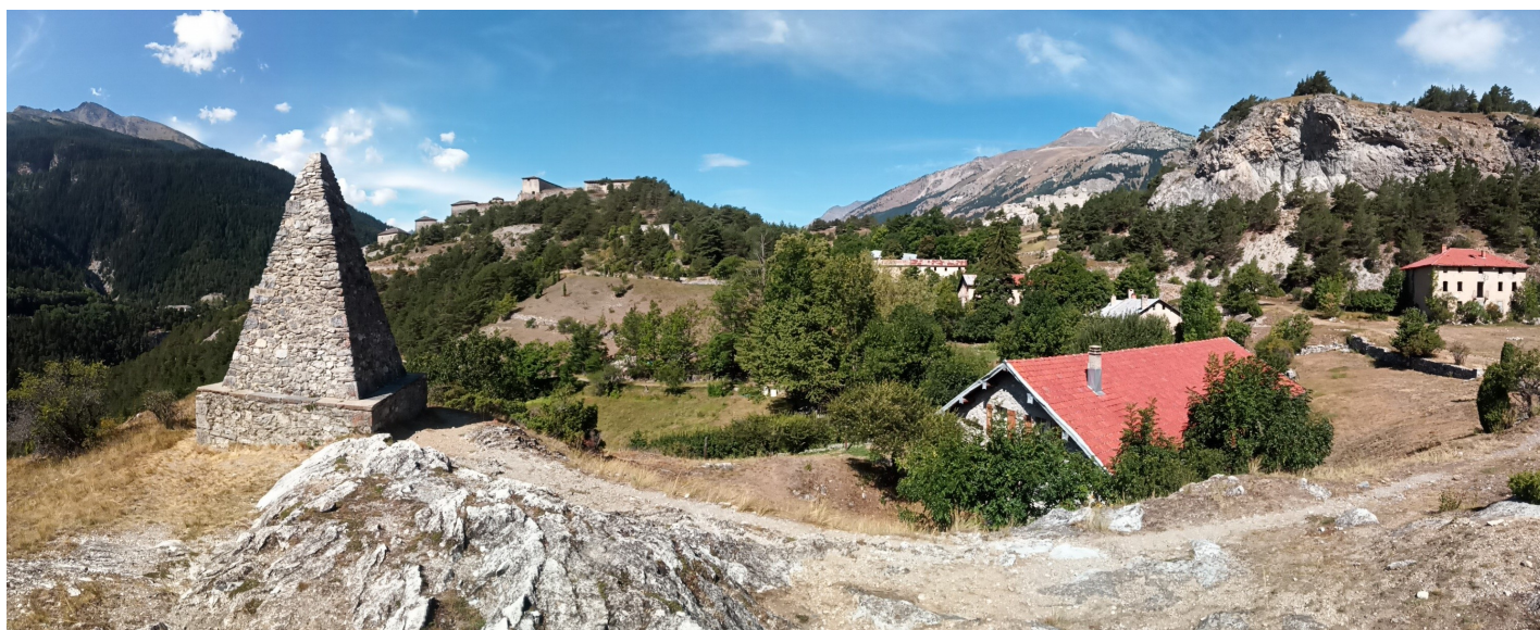
Village de l'Esseillon

Le Fort Victor-Emmanuel, construit entre 1820 et 1828, est le plus vaste ouvrage de la chaîne fortifiée : il couvrait de ses feux la redoute Marie-Thérèse et la route du Mont Cenis, et abritait la plus grande partie des casernements, ainsi que tous les services annexes nécessaires à la vie d'une garnison de 1500 hommes : chapelle, hôpital, cuisines ... Cet ensemble fut complété, dès 1833, par l'installation d'un pénitencier, essentiellement destiné à l'incarcération des opposants politiques à la monarchie sarde.