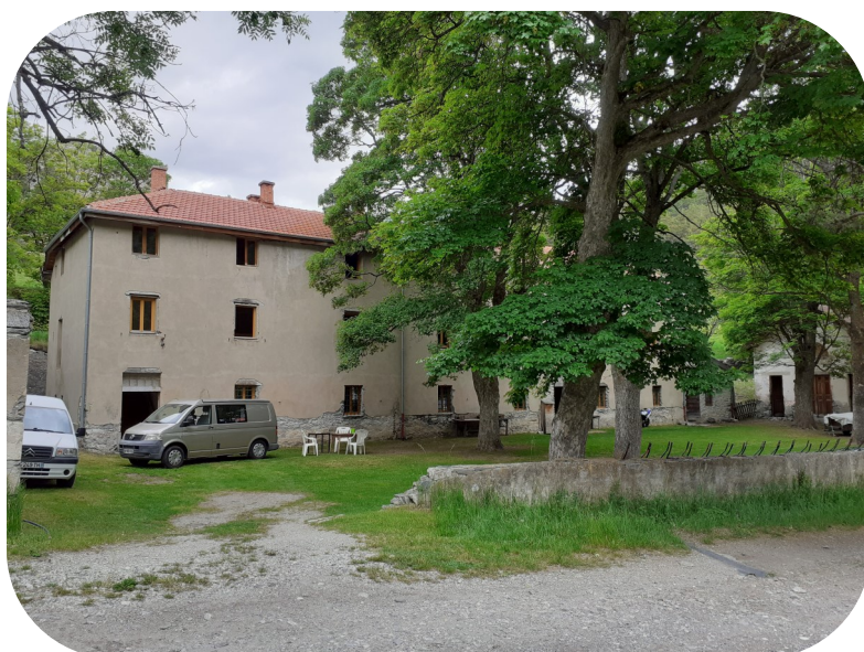
Pavillon des Sous-Officiers