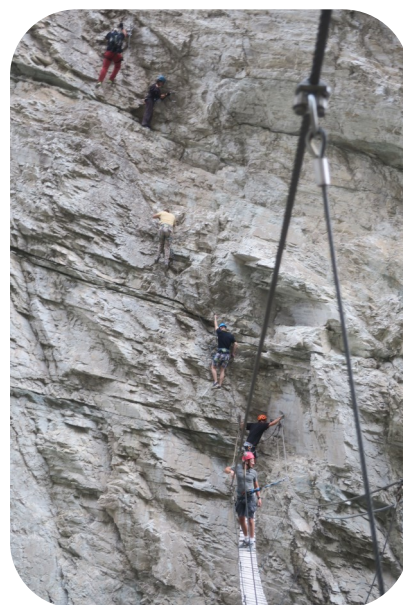
Via Ferrata du Diable

L'Association possède le matériel pour équiper plusieurs bénévoles. Elle assure aussi l'encadrement ou la formation de base pour une sortie en toute sécurité.