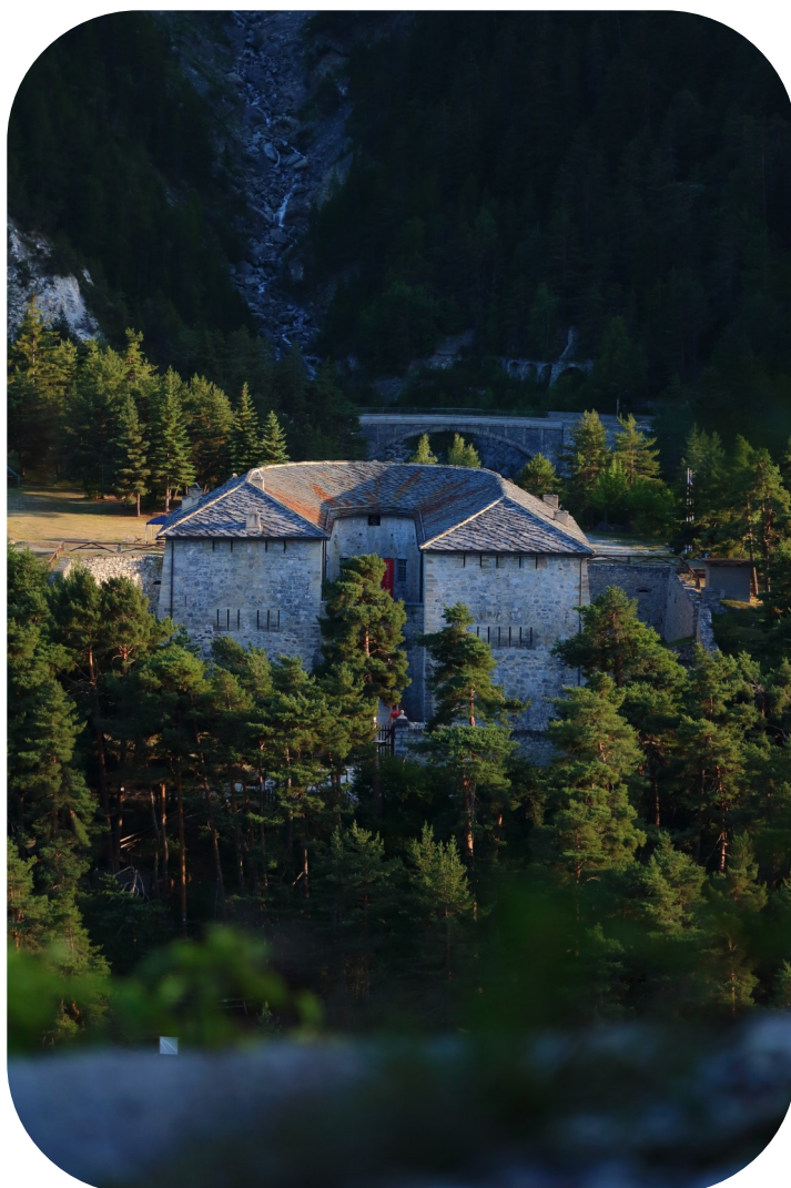
Redoute Marie-Thérèse, depuis Victor-Emmanuel

La Redoute Marie-Thérèse, située à l'extrémité basse du dispositif fortifié, fut le premier ouvrage terminé : sa construction s'acheva en 1825, alors que les autres forts étaient encore en chantier. Le rôle de la redoute consistait à contrôler la route du Mont-Cenis, séparée de la barrière rocheuse et des autres forts par les gorges de l'Arc. Malgré ses dimensions modestes et sa simplicité géométrique, la redoute est un ouvrage complexe, conçu pour fonctionner de façon pratiquement indépendante : il n'est en effet relié au fort Victor-Emmanuel que par le fragile " Pont du Diable ", malaisé d'accès, et par un monte-charge de service franchissant les gorges. La garnison de la redoute devait donc, en cas de siège, se