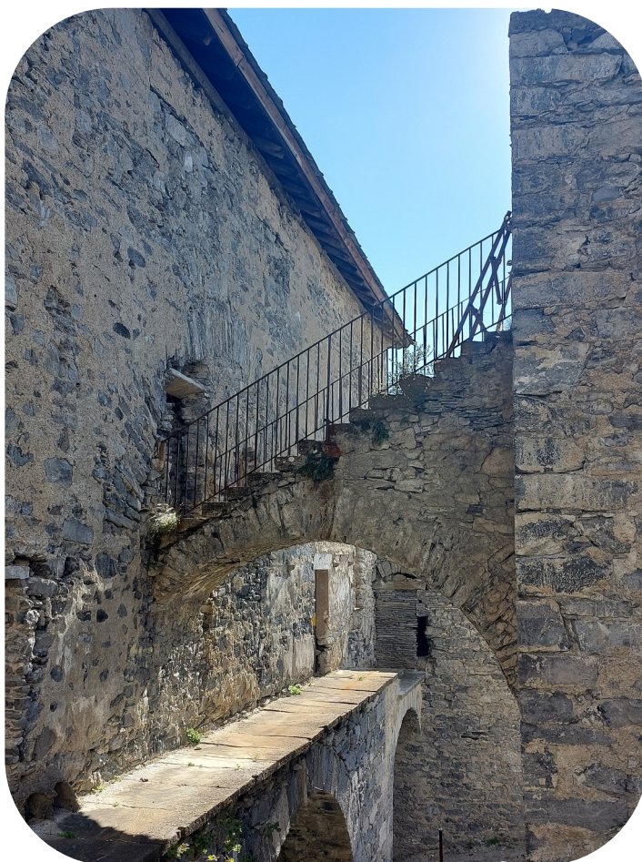
Double système de circulation du fort Victor-Emmanuel

Cet ouvrage spectaculaire est celui qui pose les plus graves problèmes de conservation, tant en raison de ces dimensions que de ses difficultés d'accès. Depuis son abandon par l'armée, à l'issue de la dernière guerre, les ouvrages n'ont cessé de se dégrader : les toitures à demi effondrées laissent s'accumuler neige et pluie sur les voûtes des casernements, et les ouvrages de maçonnerie, minés par les intempéries et le gel, commencent à s'effondrer par pans entiers, mettant directement en péril la sécurité des visiteurs.