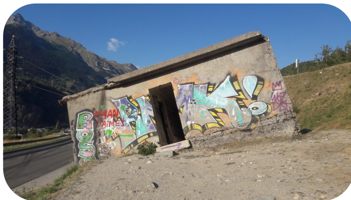
Maison penchée de Modane

Prévu pour défendre l'entrée du tunnel ferroviaire du Mont-Cenis, ce blockhaus fut projeté par l'explosion devant condamner le tunnel lors du repli des troupes allemandes en 1944. La visite de cette maison est une expérience déroutante !